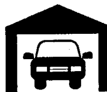
гараж или машино-место