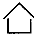
хозяйственное строение, площадь которого не превышает 50 кв.м.

налоговая ставка 0,5% – в отношении иных зданий, помещений, строений